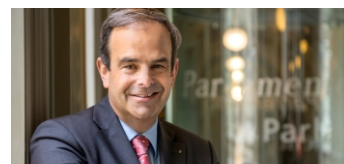
Nationalrat Dr. Gerhard Pfister