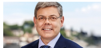
Nationalrat Franz Grüter

Stiftungsratspräsident Freiheit & Verantwortung